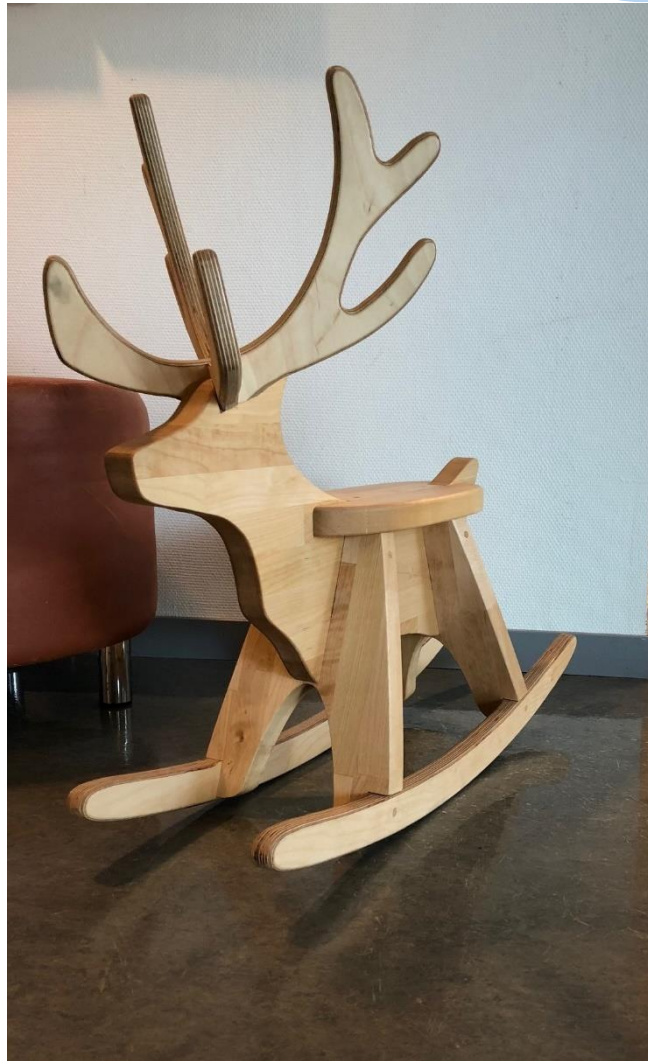
Gyngereinen på Sámi klinihkka